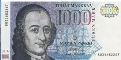
b) kuvassa rahan toisella puolella?